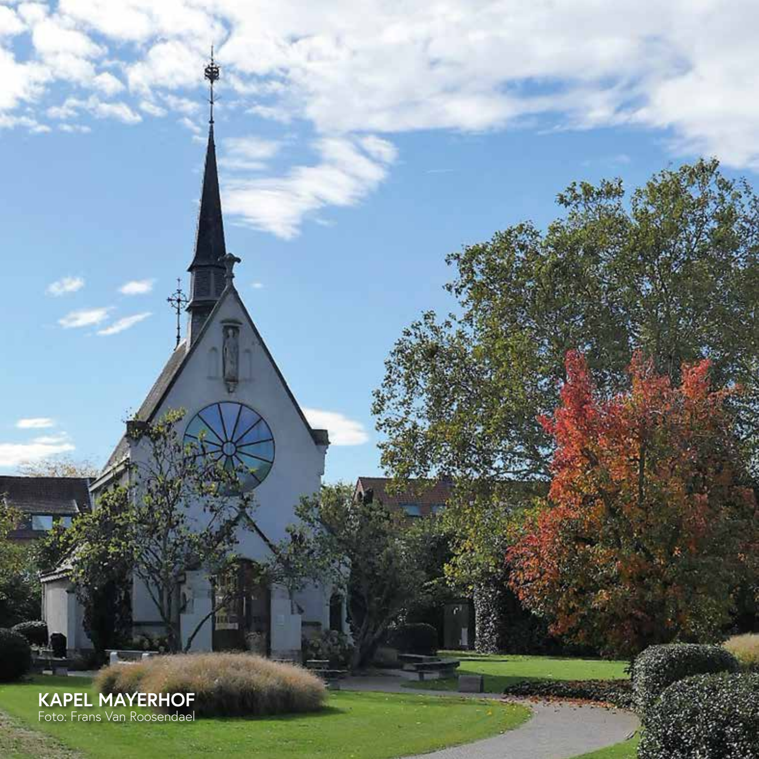
KAPEL MAYERHOF