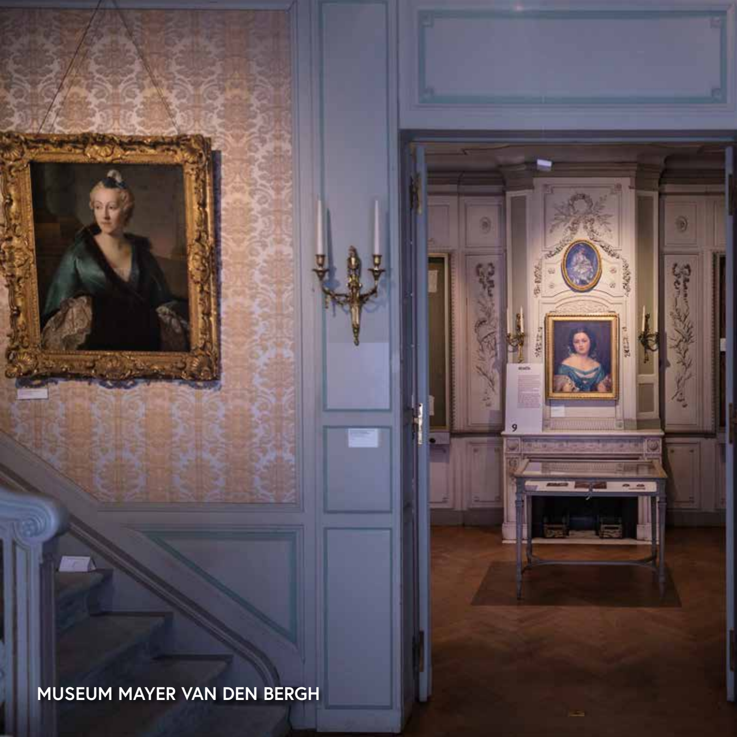
MUSEUM MAYER VAN DEN BERGH