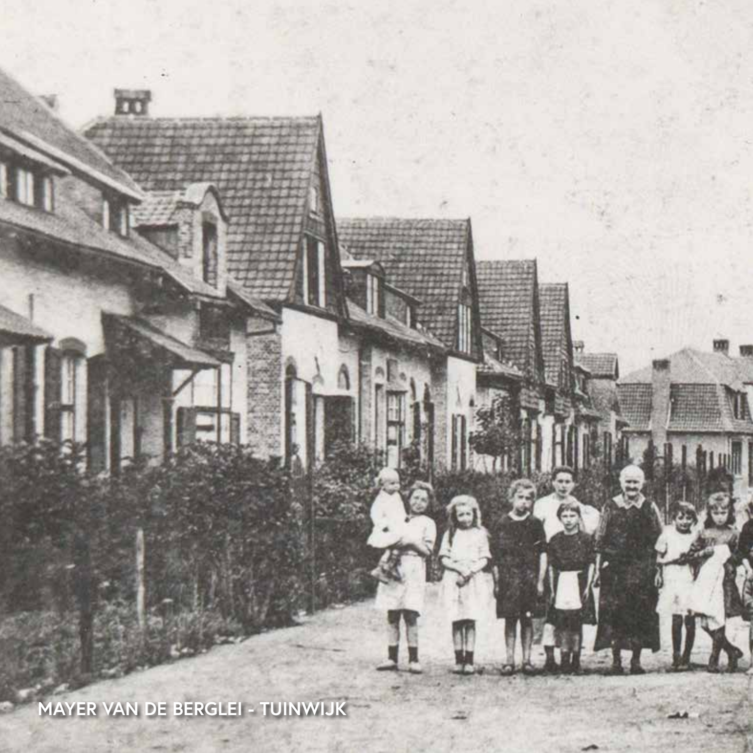
MAYER VAN DE BERGLEI - TUINWIJK