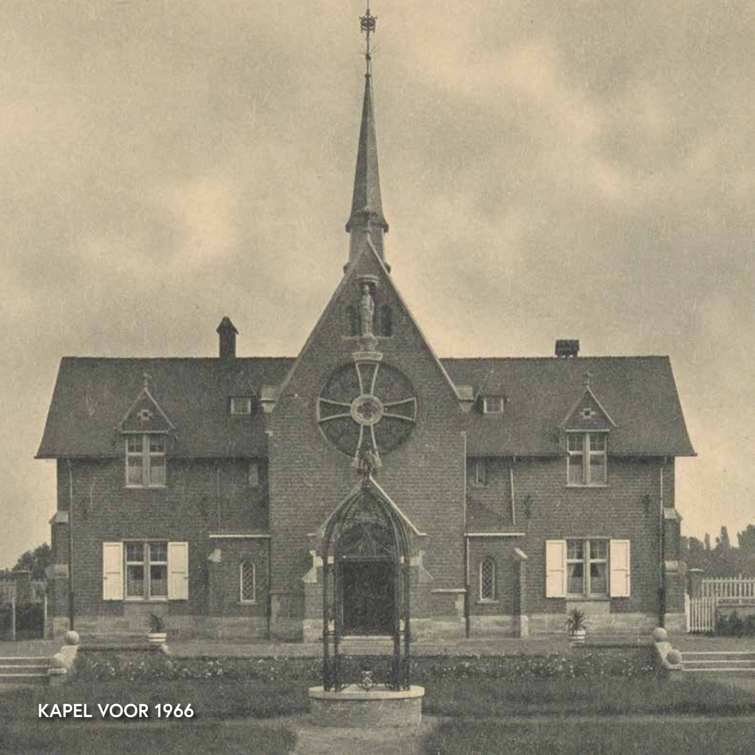
KAPEL VOOR 1966